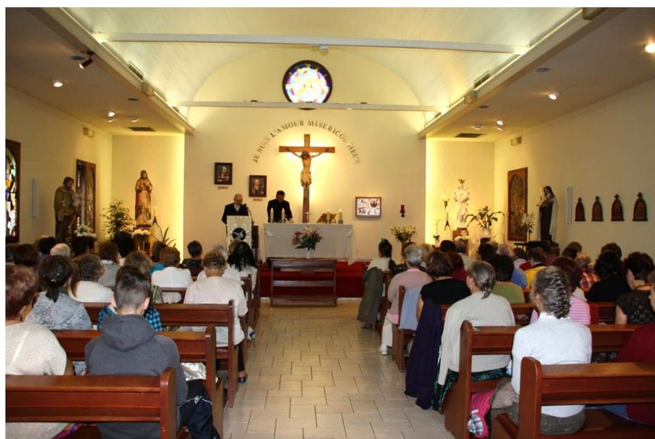
Kaplica w Chevremont